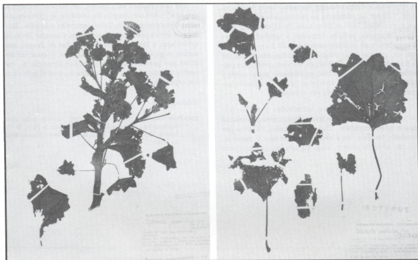
Figura 2. Tostimontia gunnerifolia S. Díaz. Pliegos de herbario correspondientes a la colección típica, R. Romero-Castañeda & S. Llinás 11288 (COL).

irregulariter dentatis basi amplexantibus sursum gradatim minoribus, foliis parvis proximalibus ipsis minoribus. Involucrum plus minusve cupulatum; phyllaria circa 7 in capitulo herbacea imbricata breviter cuspidata viridea margine scarioso eroso ciliato dorso laxe pilosa, exteriora late-ovata usque ad 10 mm longa x 8 mm lata, interiora angustiora subscariosa usque ad 10 mm longa x 3 mm lata. Receptaculum leviter convexum paleaceum; paleis 8.5 mm longis x 3 mm latis anguste-ovatis membranaceis marginibus amplexantibus. Flores omnes hermaphroditi polygami circa 50 in capitulo; corolla albida tubo angusto circa 5 mm longo glabro; lamina bilabiata, labio ventraliter elongato tenui incurvo 2-denticulato circa 3.5 mm longo; ligula glabra anguste elliptica 3-denticulata circa 6 mm longa x 2 mm lata, 4-nervata. Antherae circa 4 mm longae basi caudatae appendice apicali acuta. Stylus circa 17 mm longus ramis incurvatis circa 1 mm longis apice truncato dense papilloso hispidulis papillis punctatis. Achaenia cylindrica 2.5 – 3.0 mm longa glabra apice obtusa truncata